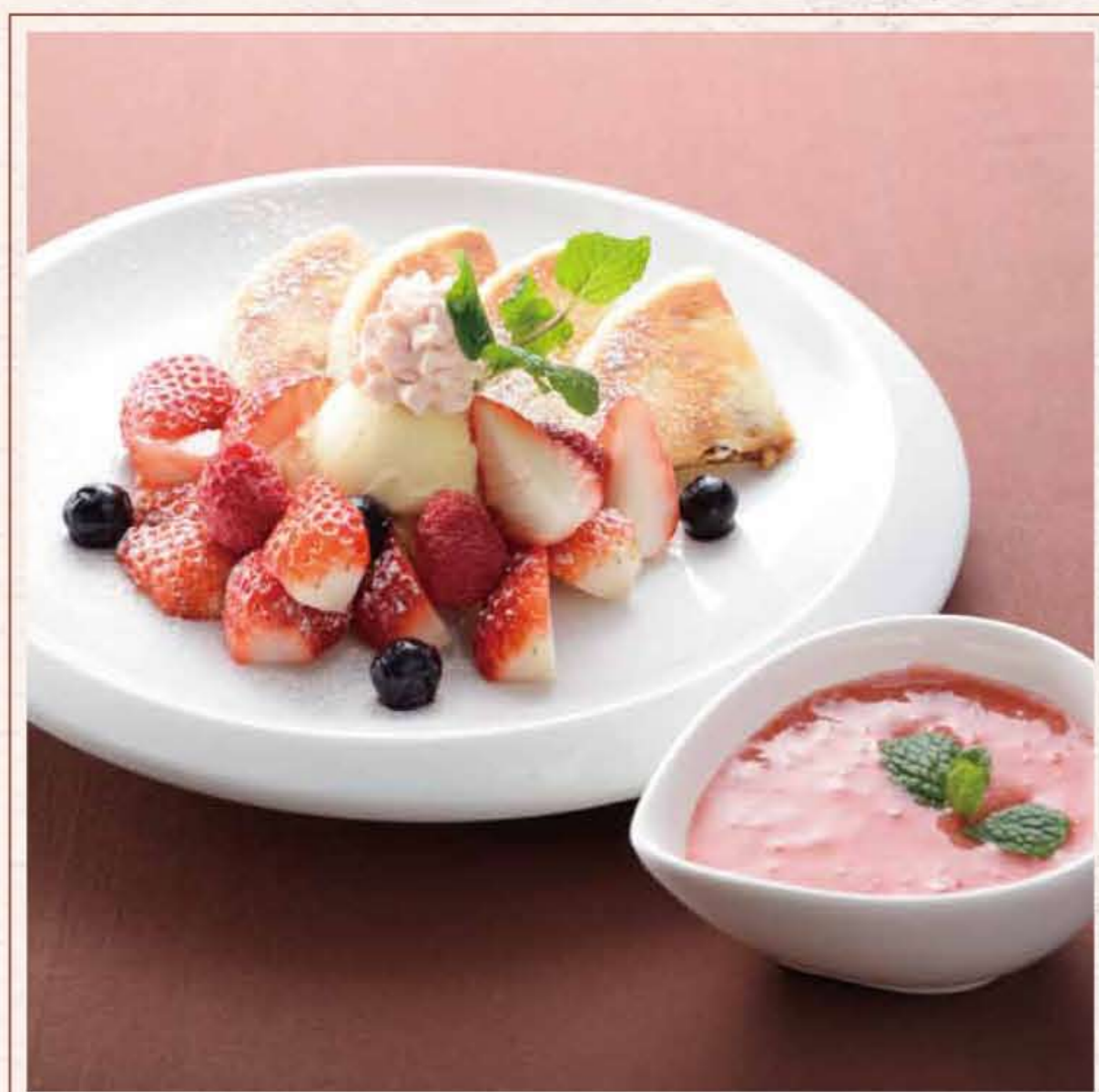
とちおとめのホットク 〜パナライス添え〜 ¥680 ホットクに、とちおとめ、ベリー、パナライスをあしらひ、特製のとちおとめソースを添えたボリューム満点の一品。プロが一品だけで好評頂いたフレッシュなとちおとめソースを活かし、目と鼻の通るバリエーションが絶妙な大人のデザートに仕上げました。 113 水刺齋 (スランジェ)