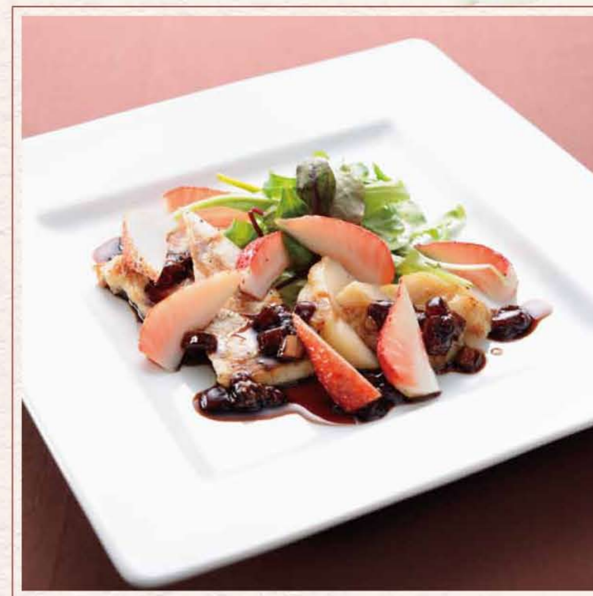
メカジキとホタテのチョコレートグリル ¥1,380 とちおとめソースと、新鮮なベリー、パナライスをあしらひ、特製のとちおとめソースを添えたボリューム満点の一品。プロが一品だけで好評頂いたフレッシュなとちおとめソースを活かし、目と鼻の通るバリエーションが絶妙な大人のデザートに仕上げました。 113 水刺齋 (スランジェ)